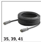
35, 39, 41