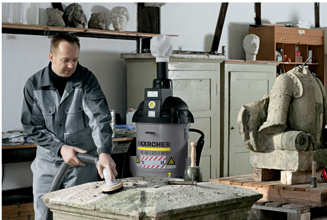
IV 60/27-1 M B1 (Z22)